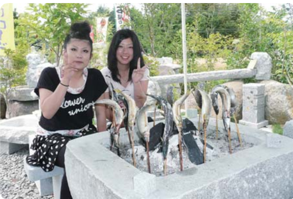
石で造った囲炉裏。

国の有形文化財指定のかやぶき古民家「大場観光ぶどう園」(石岡市佐久)にも常時展示しております。